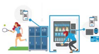
PRO SPORT A REKREACI