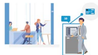
PRO ADMINISTRATIVNÍ BUDOVY