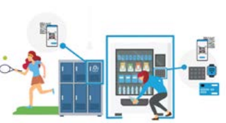
PRE ŠPORT A REKREÁCIU