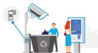
PRE MESTÁ A OBCE

Systém je ideálny pre športové centrá, telocvične, multifunkčné haly aj vonkajšie ihrisko. Uplatnenie nájde aj pri organizovaní turnajov a ďalších športových udalostí.