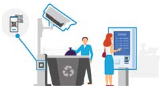
PRE MESTÁ A OBCE

SOFTPLUS eReception je ďalším veľmi univerzálnym riešením s neprebernými možnosťami využitia všade tam, kde musia byť nepretržite k dispozícii recepčné služby. Systém kompletne zautomatizuje manažment prístupu návštev a prevezme rolu existujúcich pracovníkov recepcie.