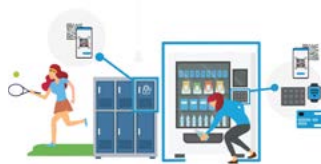
PRE ŠPORT A REKREÁCIU