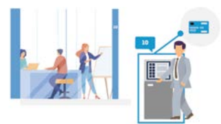
PRE ADMINISTRATÍVNE BUDOVY