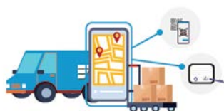
PRE SKLAD A LOGISTIKU

SOFTPLUS LPR je určený pre všetky verejné aj neverejné (firemné) parkoviská. Riešenie umožňuje nastaviť jasné pravidlá parkovania v rámci danej parkovacej plochy, pričom všetky procesy prebiehajú takmer výhradne automaticky, bez nutnosti zásahu ľudskej obsluhy.